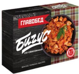
БИГУС со свиной