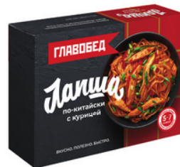
ЛАПША по-китайски с курицей