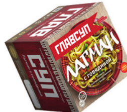
ЛАГМАН с говядиной