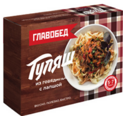
ГУЛЯШ из говядины с лапшой