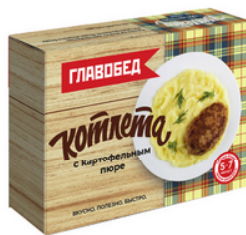
КОТЛЕТА с картофельным пюре