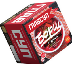
БОРЩ с курицей