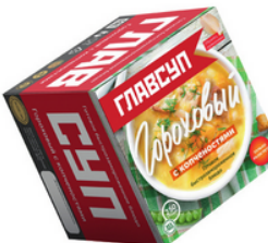
СУП гороховый с копченостями