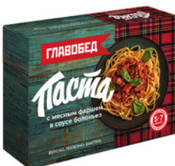
ПАСТА с мясным фаршем в соусе болоньез