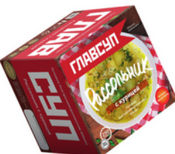
РАССОЛЬНИК с курицей