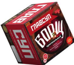
БОРЩ оригинальный с говядиной