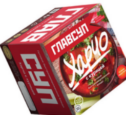
ХАРЧО с курицей