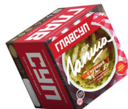
СУП-ЛАПША с курицей