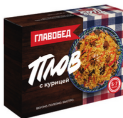
ПЛОВ с курицей