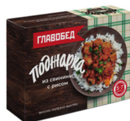
ПОДЖАРКА из свинины с рисом